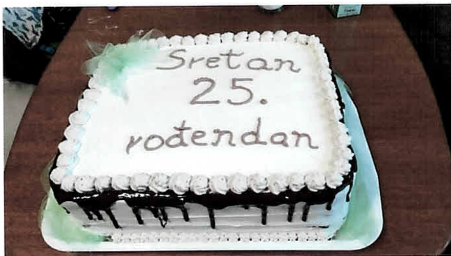
Sretan Dan Dječjeg vrtića Josipdol – Dječji vrtić Josipdol